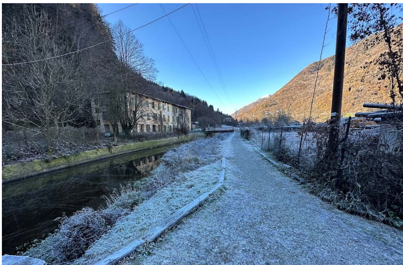
Figura 8 Vista dell'alveo (tratto dalla passerella all'impalcato esistente)