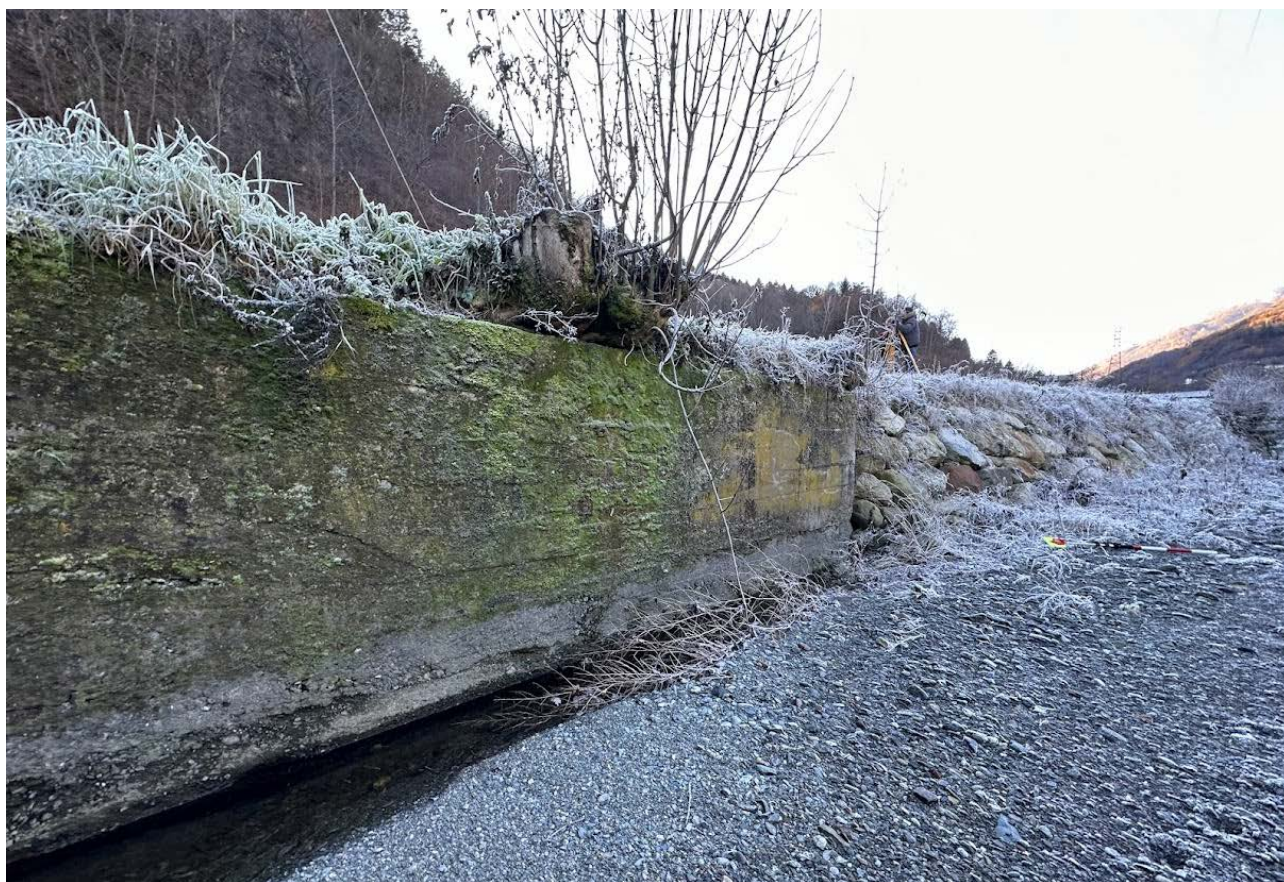
Figura 6 Muro d'argine destro verso monte (in c.a. non rivestito)