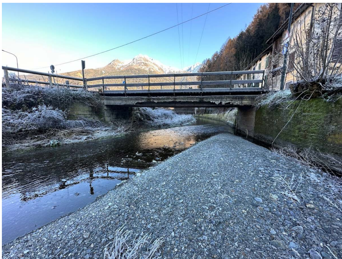
Figura 1 Ponte esistente (visto verso valle)