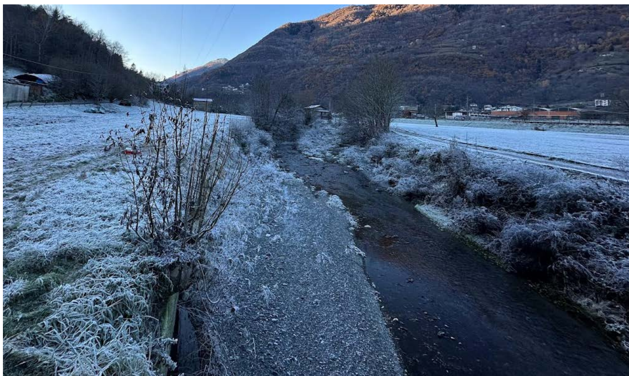
Figura 7 Vista dell'alveo (verso monte)