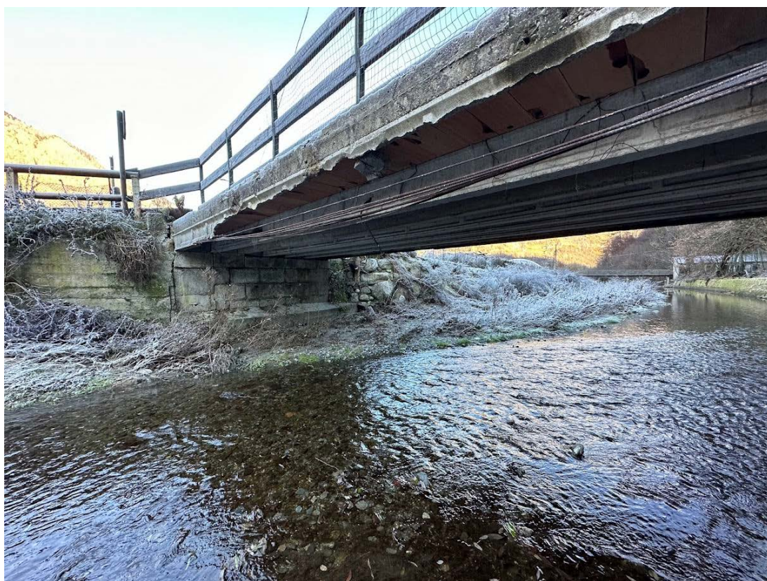
Figura 2 Impalcato esistente, spalla sinistra e tratto di muro d'argine (in c.a. non rivestito)