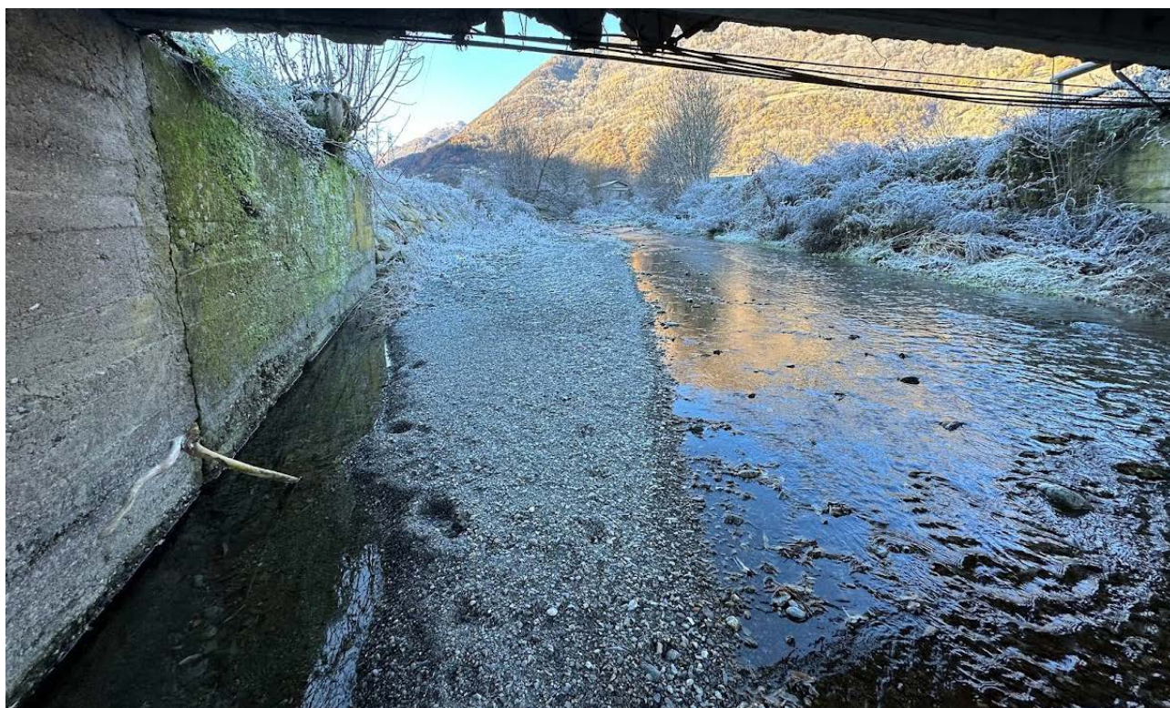
Figura 5 Spalla destra e muro d'argine destro verso monte (in c.a. non rivestito)