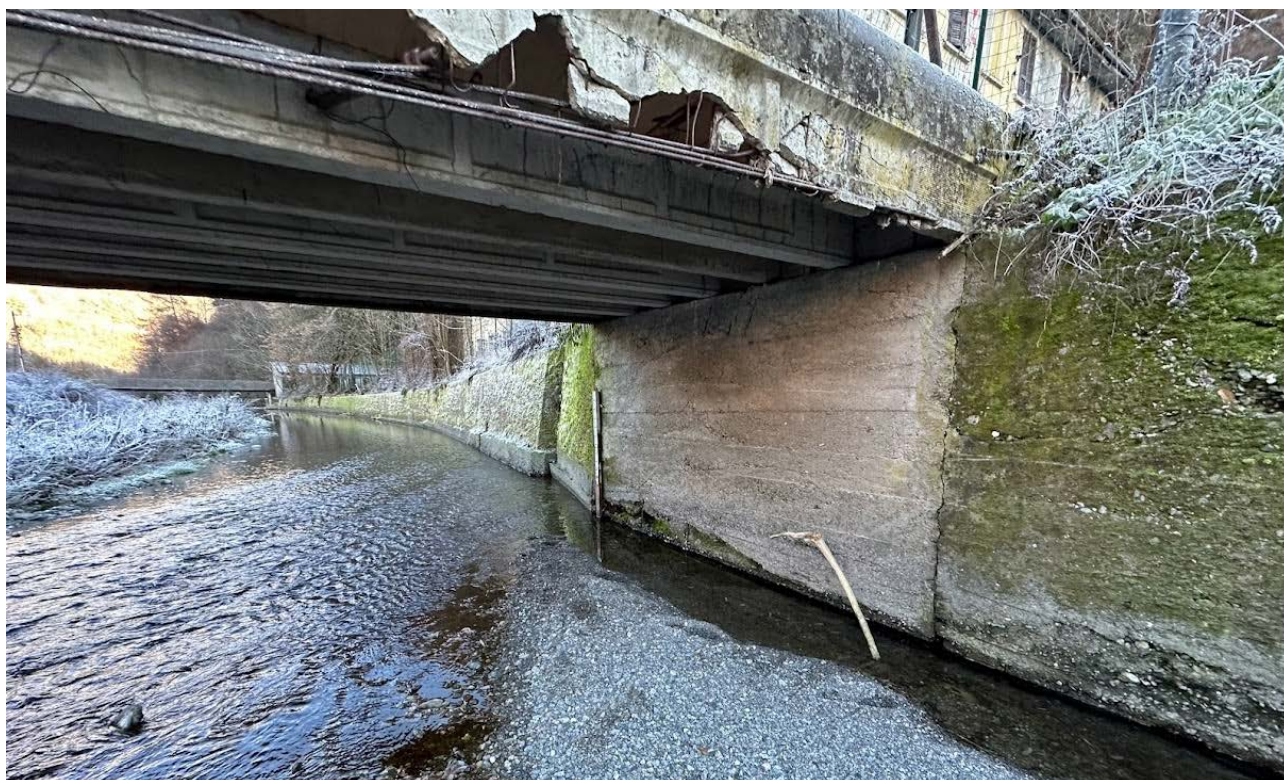
Figura 4 Spalla destra (in c.a. non rivestito)