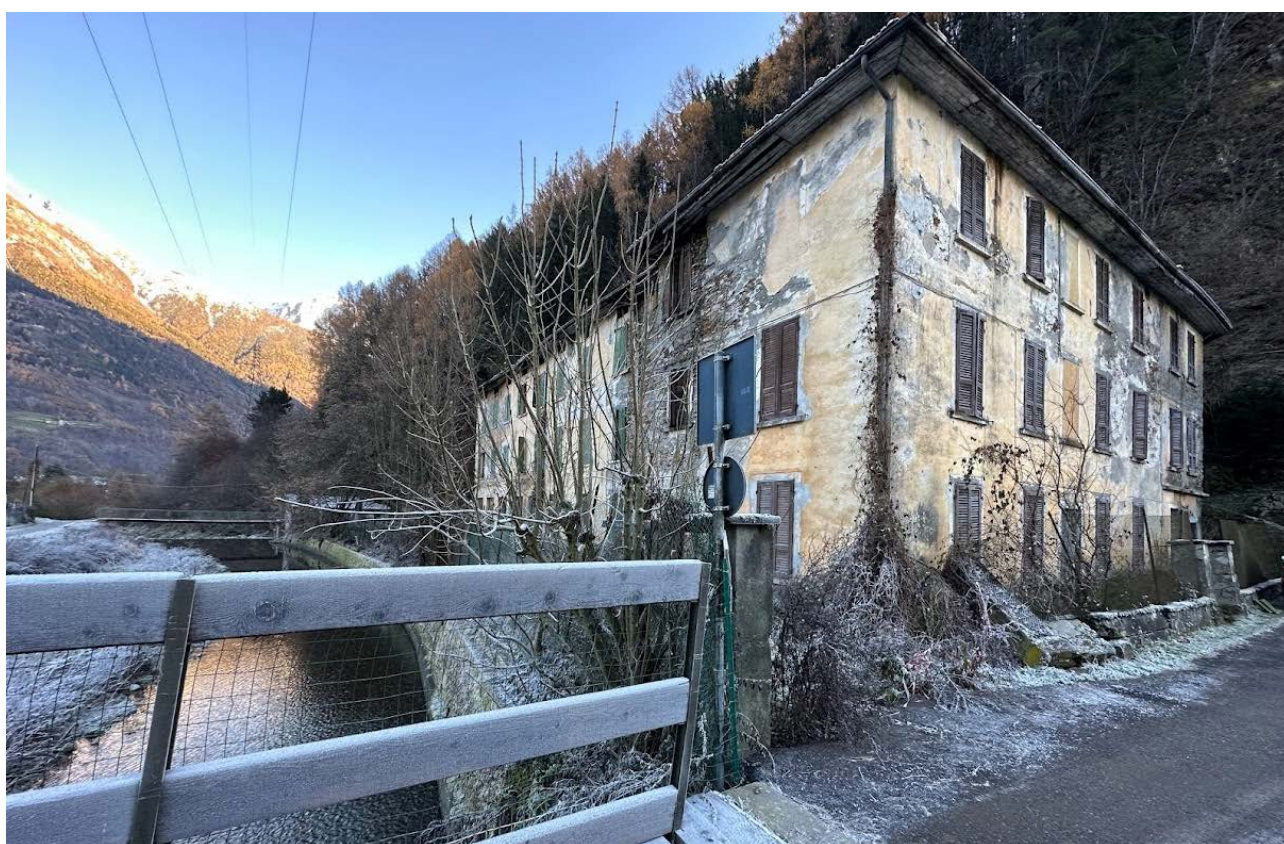
Figura 10 Fabbricato in prossimità della sponda destra