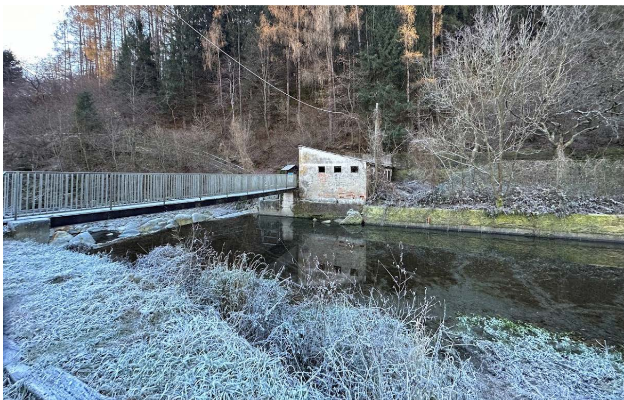
Figura 9 Vista della passerella pedonale in acciaio